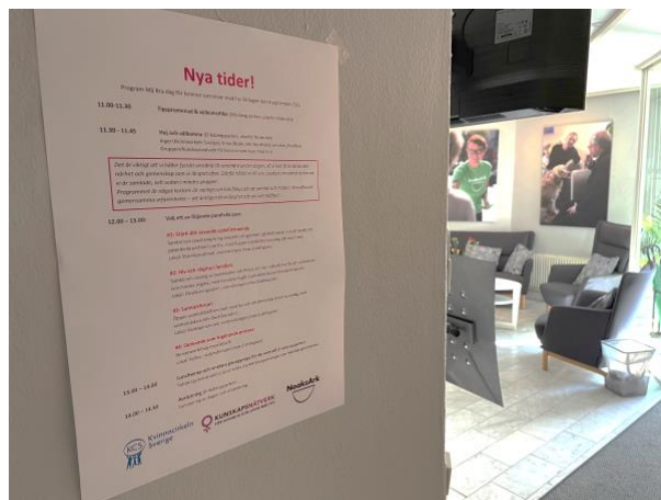
Må bra-dag arrangerades tillsammans med Noaks Ark Stockholm och Posithiva Gruppens Kunskapsnätverk för kvinnor som lever med hiv.